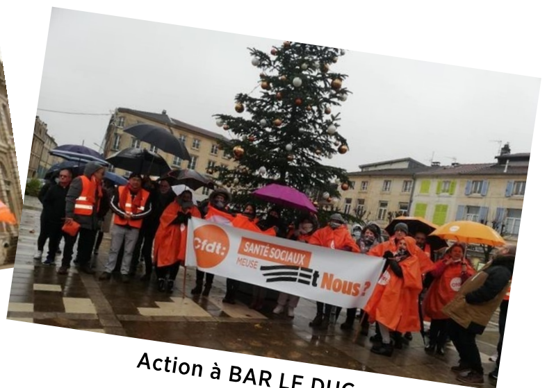
Action à BAR LE DUC