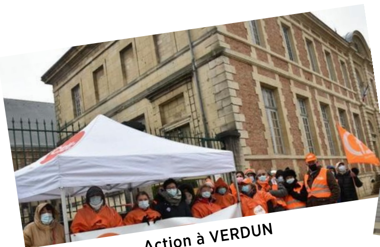
Action à VERDUN